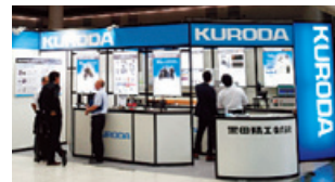
測定計測展の様子

平成27年9月、東京ビッグサイトで開催された測定計測展へ出展いたしました。この展示会では、油圧拡張式クランピングツール「ハイドロリックツール」をはじめ、真直度測定機、コンロッド測定機、歯溝測定機など自動車業界に関わりの深い製品を中心に展示いたしました。3日間の会期中には、多数の方がお越しくださいました。今回の出展では、具体的な商談に繋がる積極的な販促活動を展開いたしました。