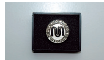
準マスターバッジ

平成27年7月に、マスター制度開始以来初となる準マスターが誕生しました。マスター制度は、高い技能を持った従業員を顕彰し、当社の技術レベルの維持向上を図るために平成24年9月に創設されました。「匠の技」を持った従業員がマスター・準マスターを目指して精進を重ね、今般社内審査に合格し、最初の準マスターが認定されました。8月には、富津工場において認定書とマスターバッジ授与式を開催しました。マスター制度を通して「精密のクロダ」の高度技能のたいまつを次世代に引き継ぎ、会社の使命である「精密技術を通じて世界の産業高度化をサポート」に全力を傾けてまいります。