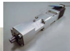
小型アクチュエータ