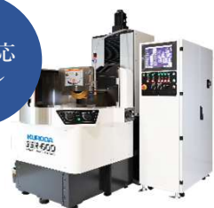
精密ロータリー研削盤 GSR-600