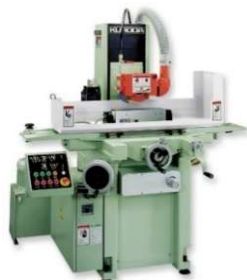
精密成形平面研削盤 GS-BMシリーズ