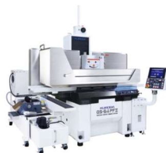
精密平面研削盤 GS-PF IIシリーズ