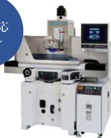
精密成形平面研削盤 GS-30/45シリーズ