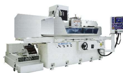
精密平面研削盤 JKシリーズ